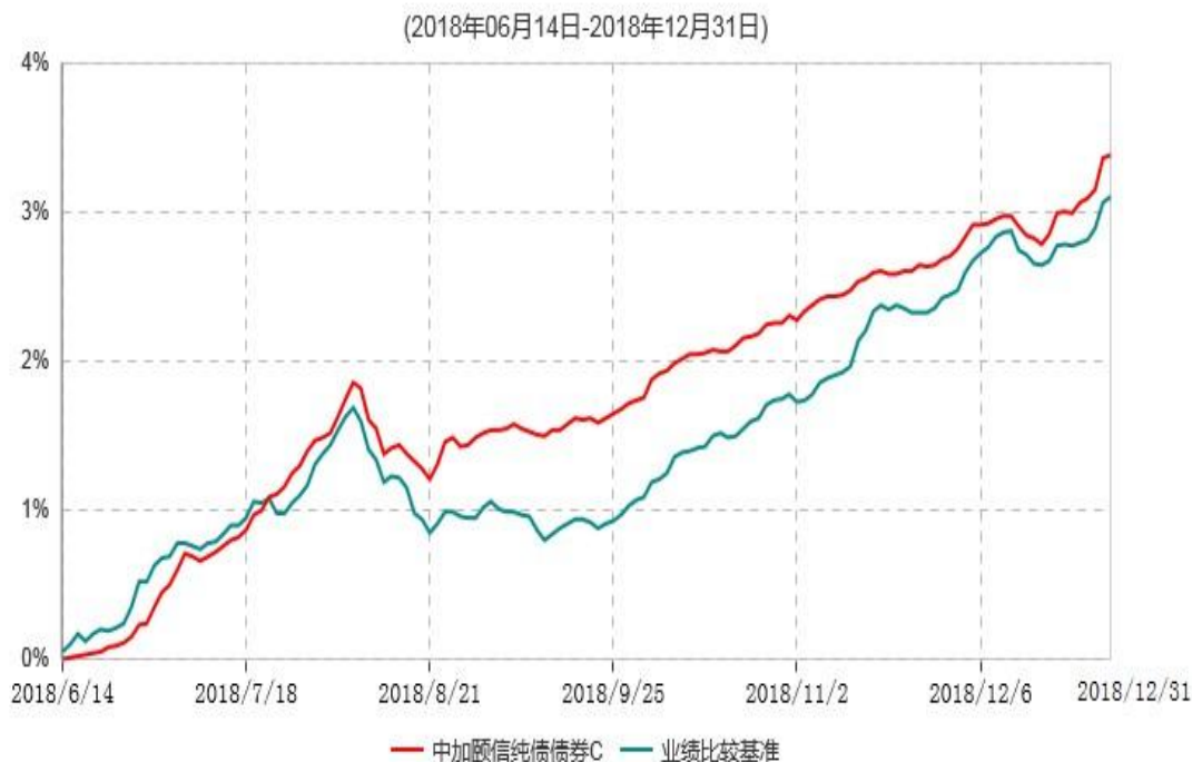
中加颐信纯债债券C累计净值增长率与业绩比较基准收益率历史走势对比图

注：1. 本基金基金合同于 2018 年 6 月 14 日生效，截至报告期末，本基金基金合同生效不满一年。 2. 按基金合同规定，本基金建仓期为 6 个月，截至报告期末，已完成建仓，本基金的各项投资比例符合基金合同关于投资范围及投资限制规定。