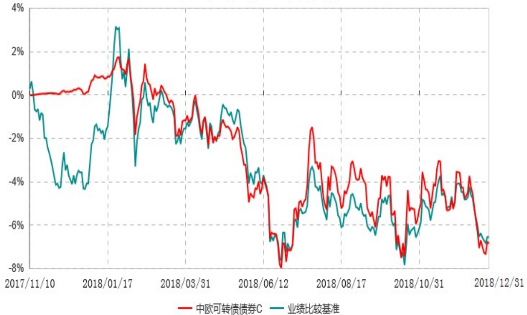
中欧可转债债券C累计净值增长率与业绩比较基准收益率历史走势对比图 (2017年11月10日-2018年12月31日)

注：本基金基金合同生效日期为 2017 年 11 月 10 日，按基金合同的规定，本基金自基金合同生效起六个月为建仓期，建仓期结束时各项资产配置比例已符合基金合同约定。