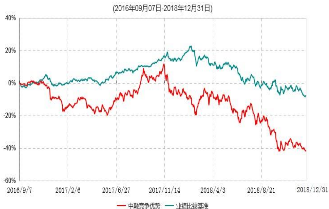
中融竞争优势股票型证券投资基金累计净值增长率与业绩比较基准收益率历史走势对比图

注：按照基金合同和招募说明书的约定，本基金自合同生效日起6个月内为建仓期，建仓期结束时本基金的各项资产配置比例符合基金合同的有关约定。