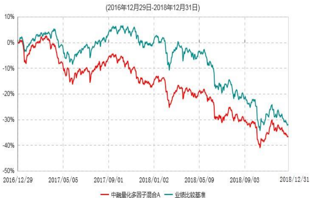
中融量化多因子混合A累计净值增长率与业绩比较基准收益率历史走势对比图