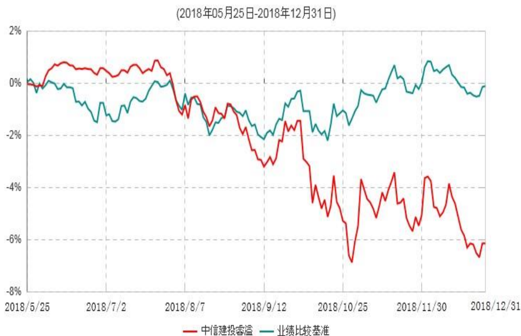
中信建投睿溢混合型证券投资基金累计净值增长率与业绩比较基准收益率历史走势对比图