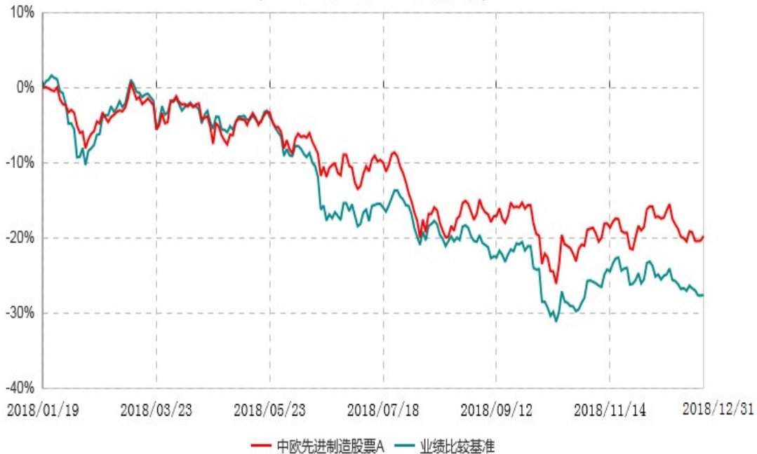
中欧先进制造股票A累计净值增长率与业绩比较基准收益率历史走势对比图 (2018年01月19日-2018年12月31日)

注：本基金基金合同生效日期为2018年1月19日，自基金合同生效日起到本报告期末不满一年，按基金合同的规定，本基金自基金合同生效起六个月为建仓期，建仓期