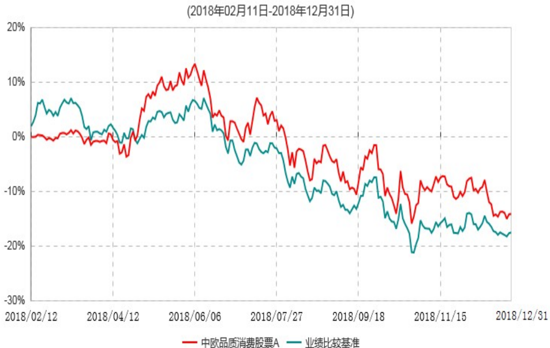
中欧品质消费股票A累计净值增长率与业绩比较基准收益率历史走势对比图