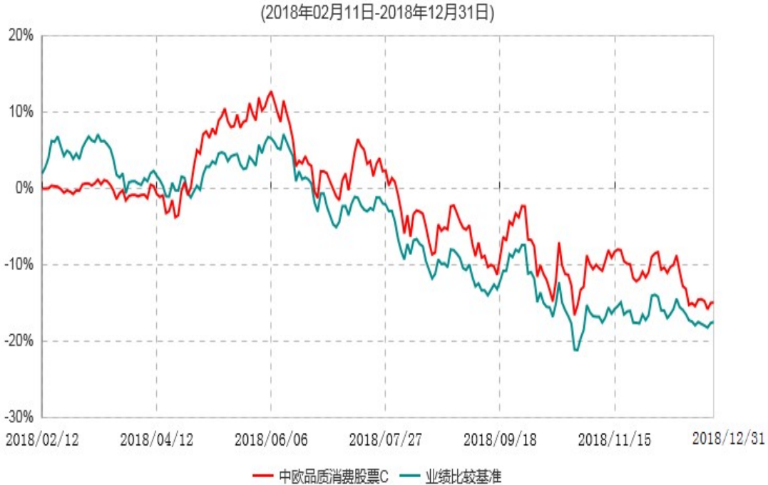
中欧品质消费股票C累计净值增长率与业绩比较基准收益率历史走势对比图

注：本基金基金合同生效日期为 2018 年 2 月 11 日，自基金合同生效日起到本报告期末不满一年，按基金合同的规定，本基金自基金合同生效起六个月为建仓期，建仓期结束时各项资产配置比例已符合基金合同约定。