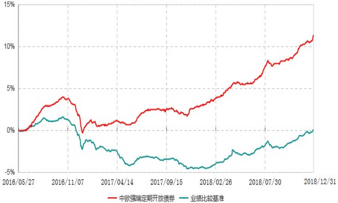
中欧强瑞多策略定期开放债券型证券投资基金累计净值增长率与业绩比较基准收益率历史走势对比图 (2016年05月27日-2018年12月31日)