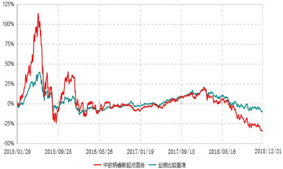
中欧明睿新起点混合型证券投资基金累计净值增长率与业绩比较基准收益率历史走势对比图 (2015年01月29日-2018年12月31日)