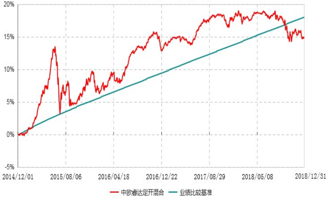
中欧睿达定期开放混合型发起式证券投资基金累计净值增长率与业绩比较基准收益率历史走势对比图 (2014年12月01日-2018年12月31日)