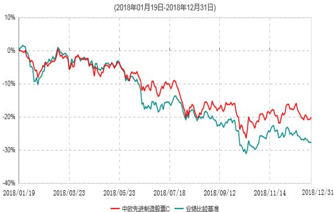
中欧先进制造股票C累计净值增长率与业绩比较基准收益率历史走势对比图

注：本基金基金合同生效日期为2018年1月19日，自基金合同生效日起到本报告期末不满一年，按基金合同的规定，本基金自基金合同生效起六个月为建仓期，建仓期结束时各项资产配置比例已符合基金合同约定。