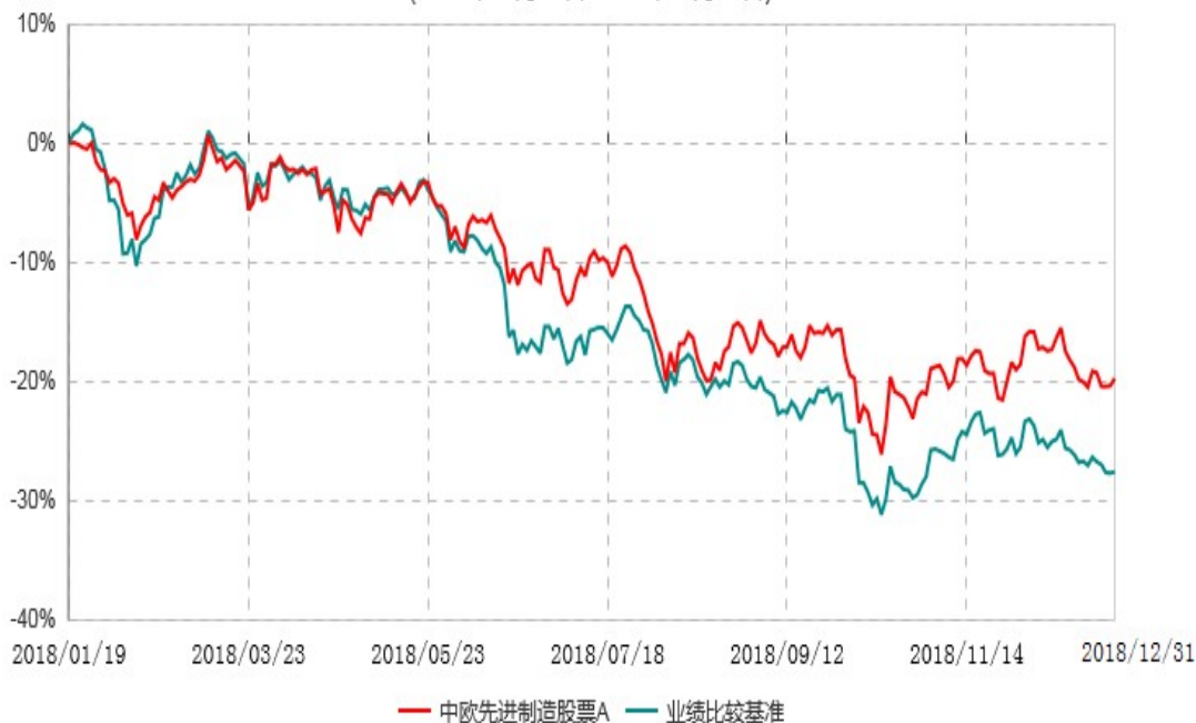
中欧先进制造股票A累计净值增长率与业绩比较基准收益率历史走势对比图 (2018年01月19日-2018年12月31日)

注：本基金基金合同生效日期为2018年1月19日，自基金合同生效日起到本报告期末不满一年，按基金合同的规定，本基金自基金合同生效起六个月为建仓期，建仓期结束时各项资产配置比例已符合基金合同约定。