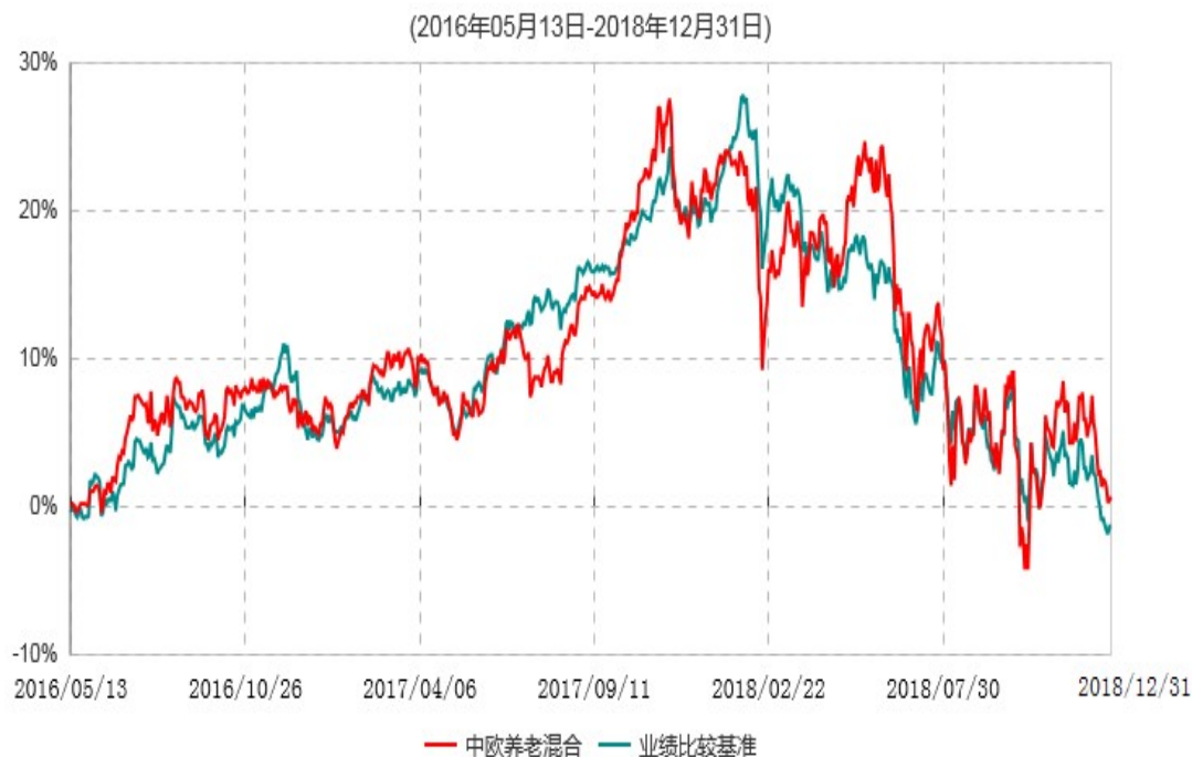
中欧养老产业混合型证券投资基金累计净值增长率与业绩比较基准收益率历史走势对比图