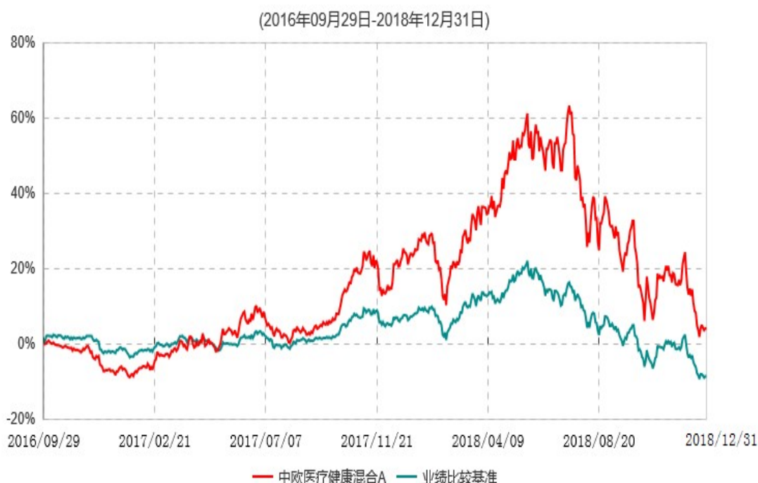
中欧医疗健康混合A累计净值增长率与业绩比较基准收益率历史走势对比图