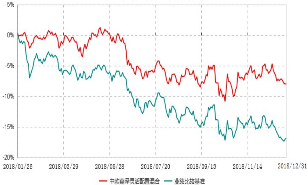
中欧嘉泽灵活配置混合型证券投资基金累计净值增长率与业绩比较基准收益率历史走势对比图 (2018年01月26日-2018年12月31日)

注：本基金基金合同生效日期为2018年1月26日，自基金合同生效日起到本报告期末不满一年，按基金合同的规定，本基金自基金合同生效起六个月为建仓期，建仓期结束时各项资产配置比例已符合基金合同约定。