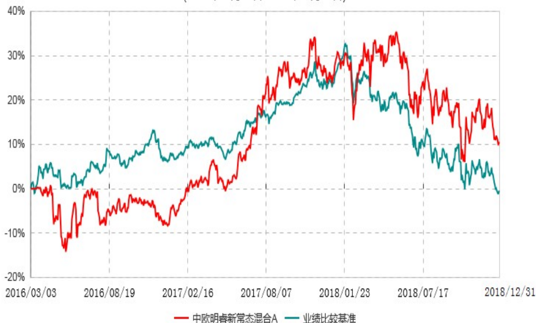
中欧明睿新常态混合C累计净值增长率与业绩比较基准收益率历史走势对比图