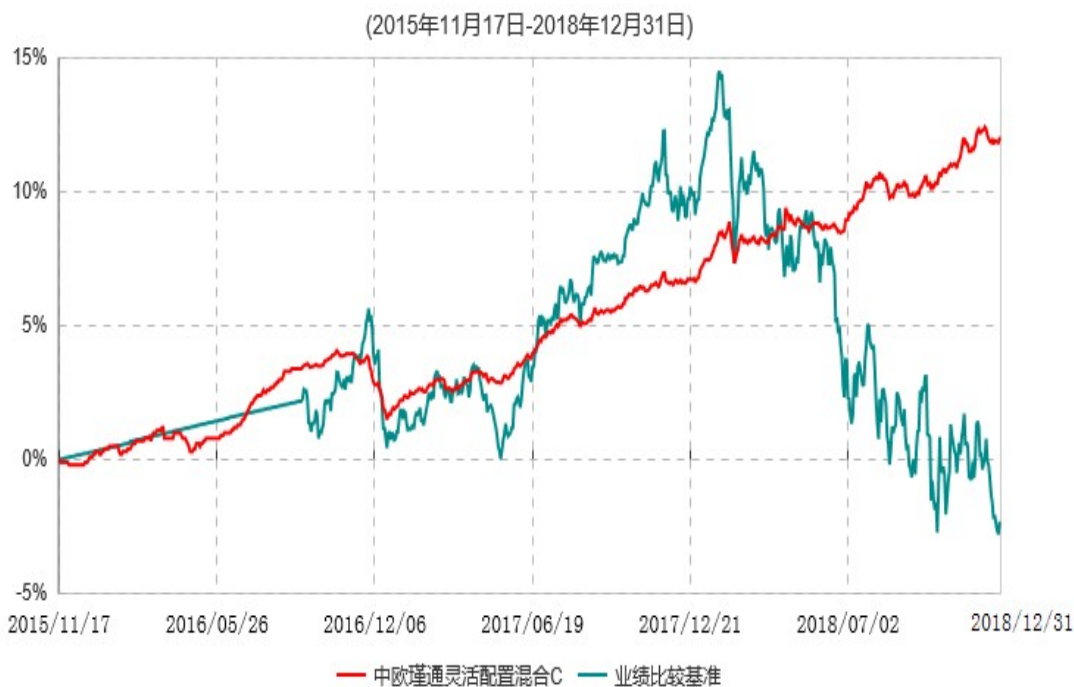
中欧瑾通灵活配置混合C累计净值增长率与业绩比较基准收益率历史走势对比图

注：自 2016 年 9 月 5 日起，变更业绩比较基准至沪深 300 指数收益率*50%+中债综合指数收益率*50%。