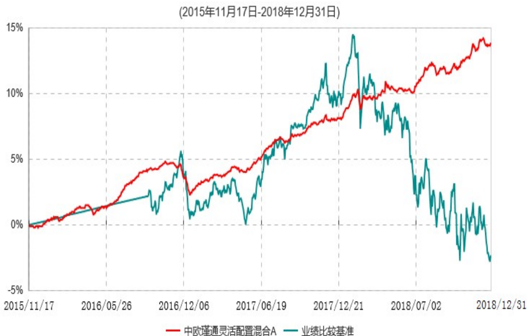
中欧瑾通灵活配置混合A累计净值增长率与业绩比较基准收益率历史走势对比图

注：自 2016 年 9 月 5 日起，变更业绩比较基准至沪深 300 指数收益率*50%+中债综合指数收益率*50%。