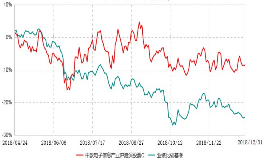
中欧电子信息产业沪港深股票C累计净值增长率与业绩比较基准收益率历史走势对比图 (2018年04月23日-2018年12月31日)

注：本基金基金合同生效日期为 2017 年 7 月 7 日，按基金合同的规定，本基金自基金合同生效起六个月为建仓期，建仓期结束时各项资产配置比例已达到基金合同约定。