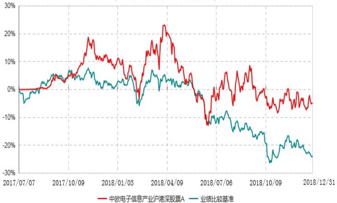
中欧电子信息产业沪港深股票A累计净值增长率与业绩比较基准收益率历史走势对比图 (2017年07月07日-2018年12月31日)

注：本基金基金合同生效日期为 2017 年 7 月 7 日，按基金合同的规定，本基金自基金合同生效起六个月为建仓期，建仓期结束时各项资产配置比例已达到基金合同约定。