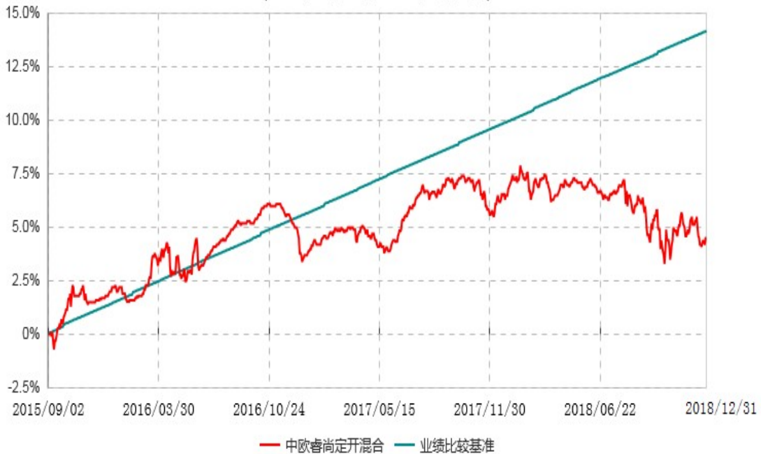
中欧睿尚定期开放混合型发起式证券投资基金累计净值增长率与业绩比较基准收益率历史走势对比图 (2015年09月02日-2018年12月31日)