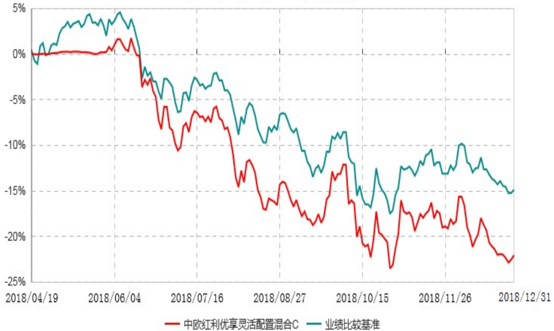
中欧红利优享灵活配置混合C累计净值增长率与业绩比较基准收益率历史走势对比图 (2018年04月19日-2018年12月31日)

注：本基金基金合同生效日期为2018年4月19日，自基金合同生效日起到本报告期末不满一年，按基金合同的规定，本基金自基金合同生效起六个月为建仓期，建仓期结束时各项资产配置比例已符合基金合同约定。