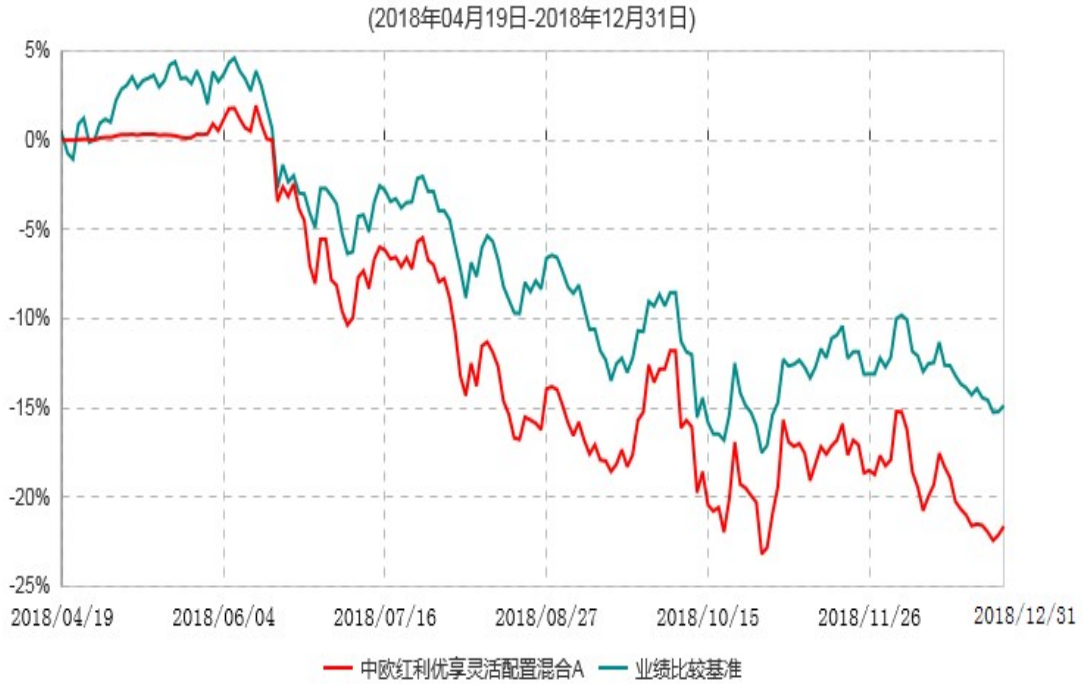
中欧红利优享灵活配置混合A累计净值增长率与业绩比较基准收益率历史走势对比图

注：本基金基金合同生效日期为 2018 年 4 月 19 日，自基金合同生效日起到本报告期末不满一年，按基金合同的规定，本基金自基金合同生效起六个月为建仓期，建仓期结束时各项资产配置比例已符合基金合同约定。