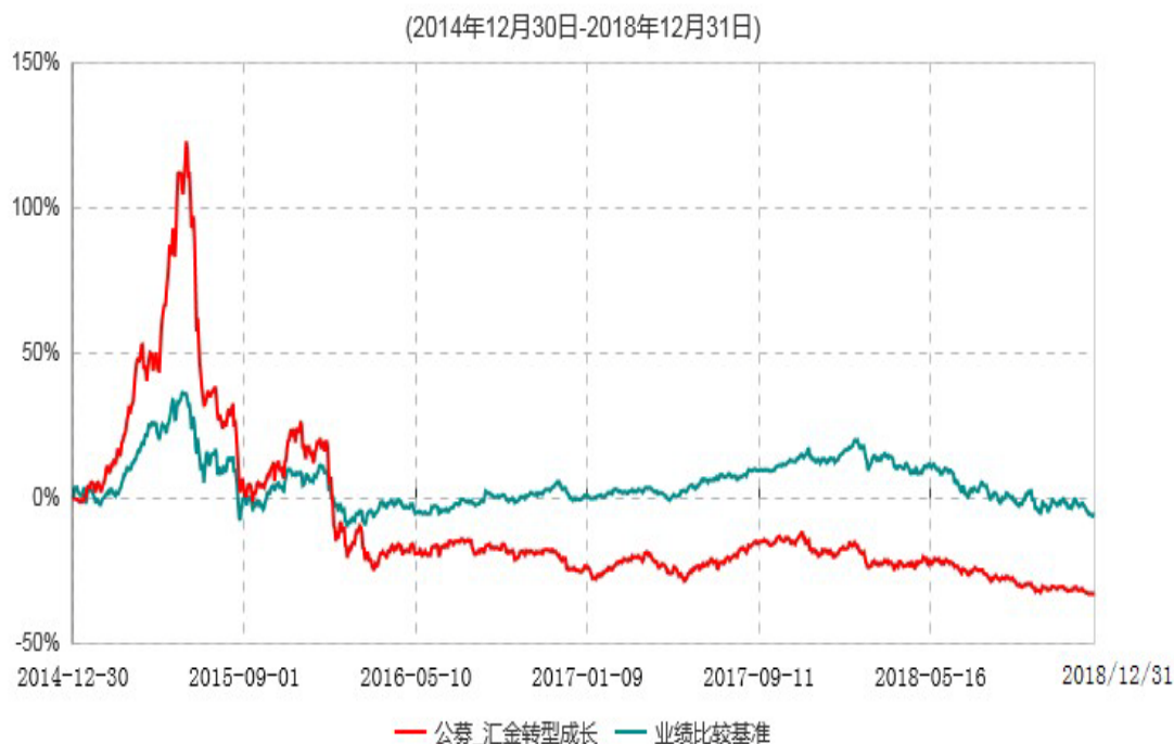
浙商汇金转型成长混合型证券投资基金累计净值增长率与业绩比较基准收益率历史走势对比图