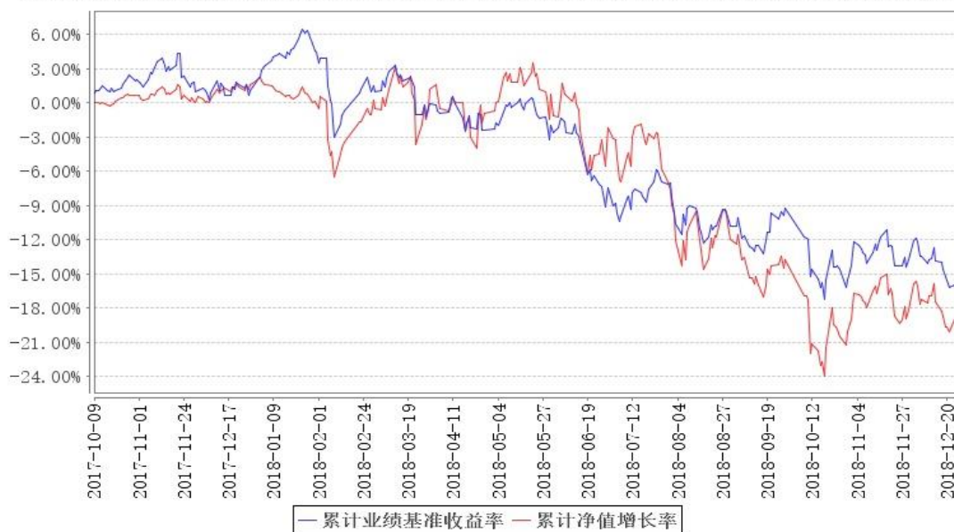
鹏华研究精选混合累计净值增长率与同期业绩比较基准收益率的历史走势对比图