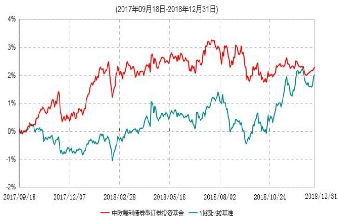
中欧鼎利债券型证券投资基金累计净值增长率与业绩比较基准收益率历史走势对比图

注：本基金转型生效日为2017年9月18日，图示日期为2017年9月18日至2018年12月31日。