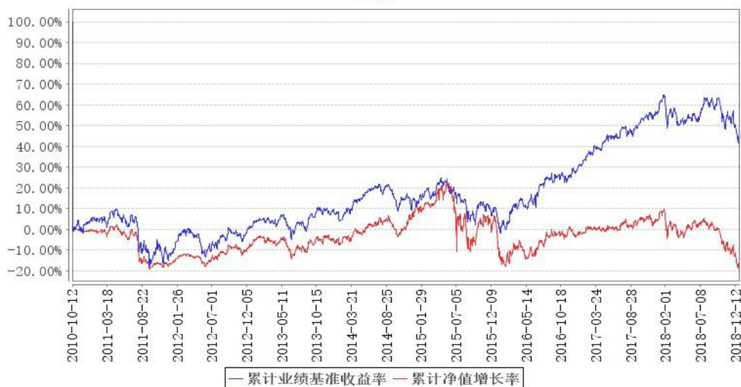
鹏华环球发现(QDII-FOF)累计净值增长率与同期业绩比较基准收益率的历史走势对比图