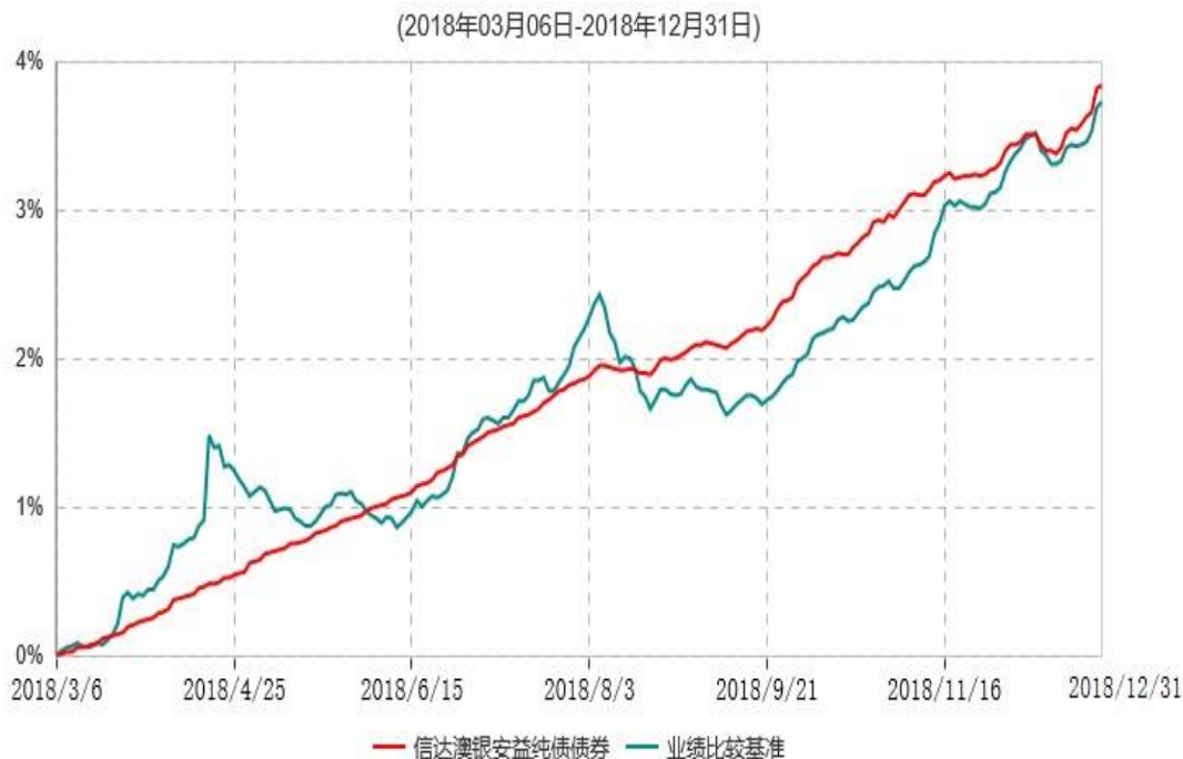
信达澳银安益纯债债券型证券投资基金累计净值增长率与业绩比较基准收益率历史走势对比图