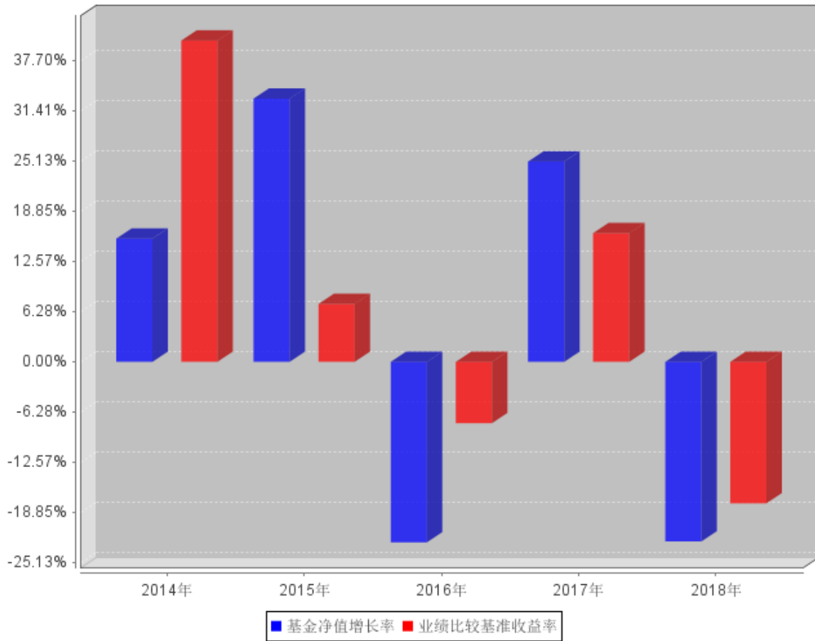
过去五年基金每年净值增长率及其与同期业绩比较基准收益率的对比图