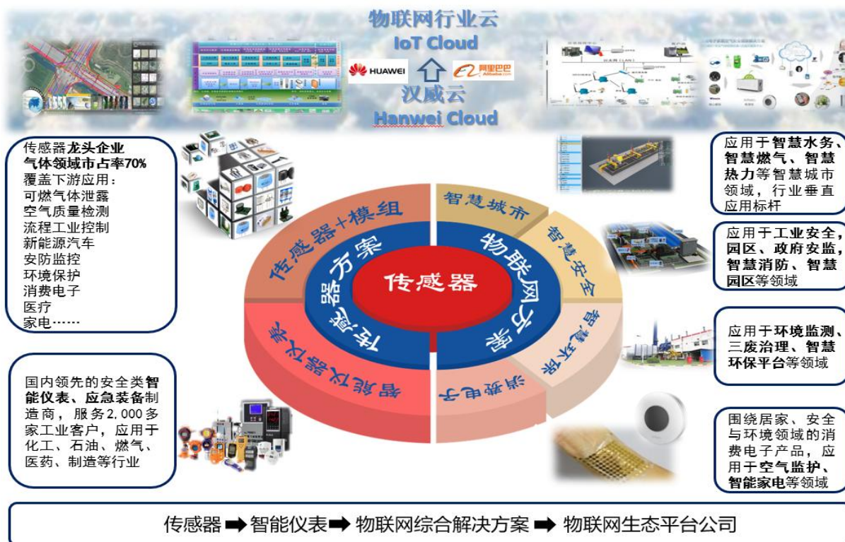
图 1 汉威科技物联网战略导图