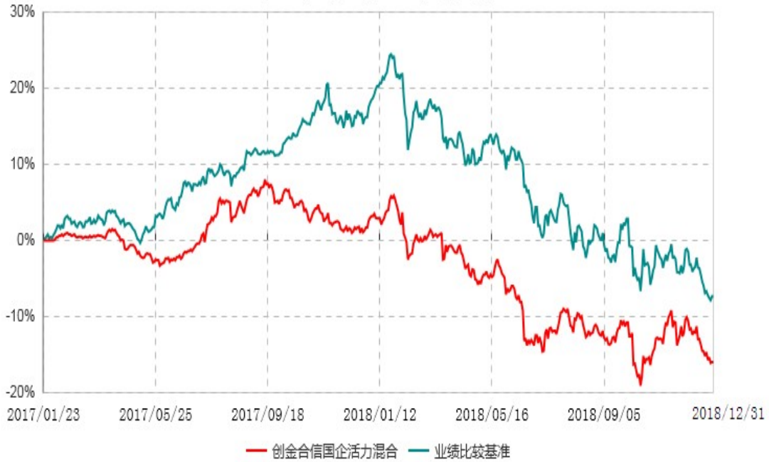
创金合信国企活力混合型证券投资基金累计净值增长率与业绩比较基准收益率历史走势对比图 (2017年01月23日-2018年12月31日)