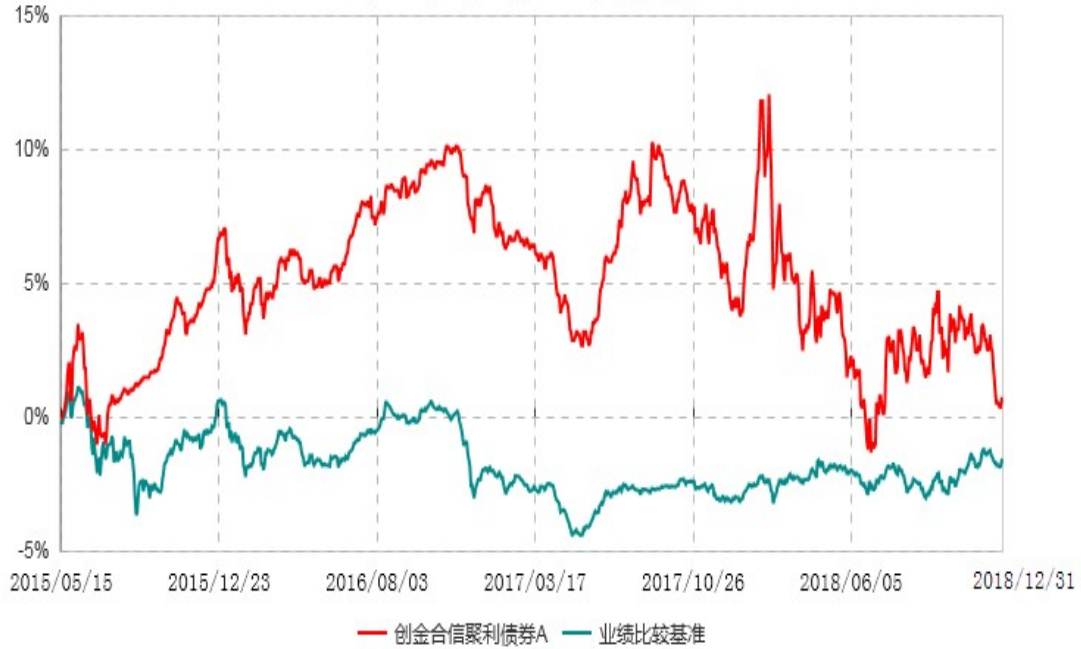
创金合信聚利债券A累计净值增长率与业绩比较基准收益率历史走势对比图 (2015年05月15日-2018年12月31日)