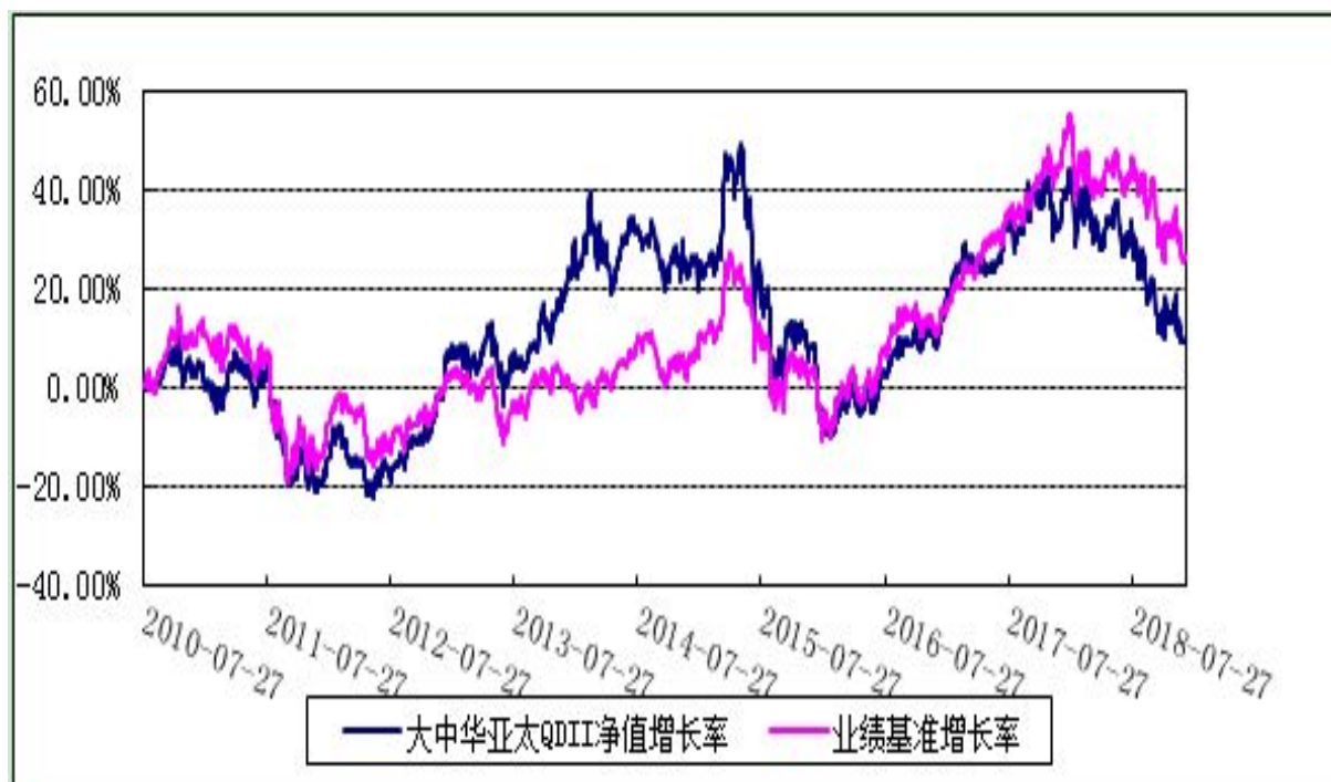
博时大中华亚太精选股票证券投资基金 份额累计净值增长率与业绩比较基准收益率历史走势对比图 (2010年7月27日至2018年12月31日)