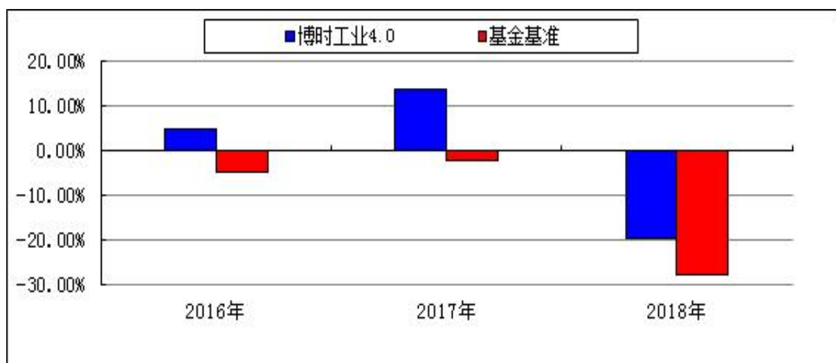
自基金合同生效以来基金净值增长率与业绩比较基准收益率的对比图

注：本基金的基金合同于 2016 年 6 月 8 日生效，合同生效当年按实际存续期计算，不按整个自然年度进行折算。