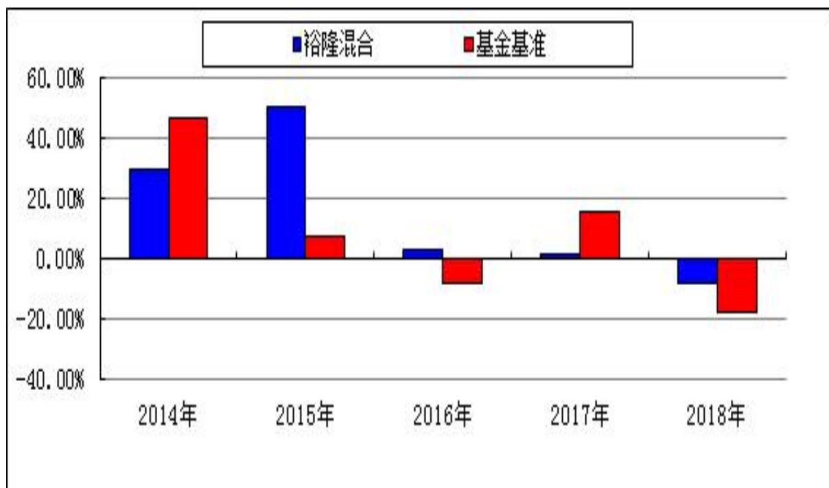
自基金转型以来基金净值增长率与业绩比较基准收益率的对比图

注：本基金的基金合同于 2014 年 6 月 3 日生效，合同生效当年按实际存续期计算，不按整个自然年度进行折算。