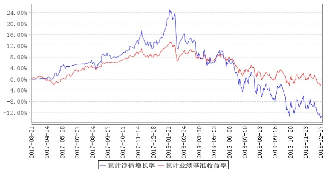
大成智惠量化多策略混合累计净值增长率与同期业绩比较基准收益率的历史走势对比图

注:按本基金合同规定,基金管理人应当自基金合同生效之日起六个月内使基金的投资组合比例符合基金合同的约定。建仓期结束时,本基金的投资组合比例符合基金合同的约定。