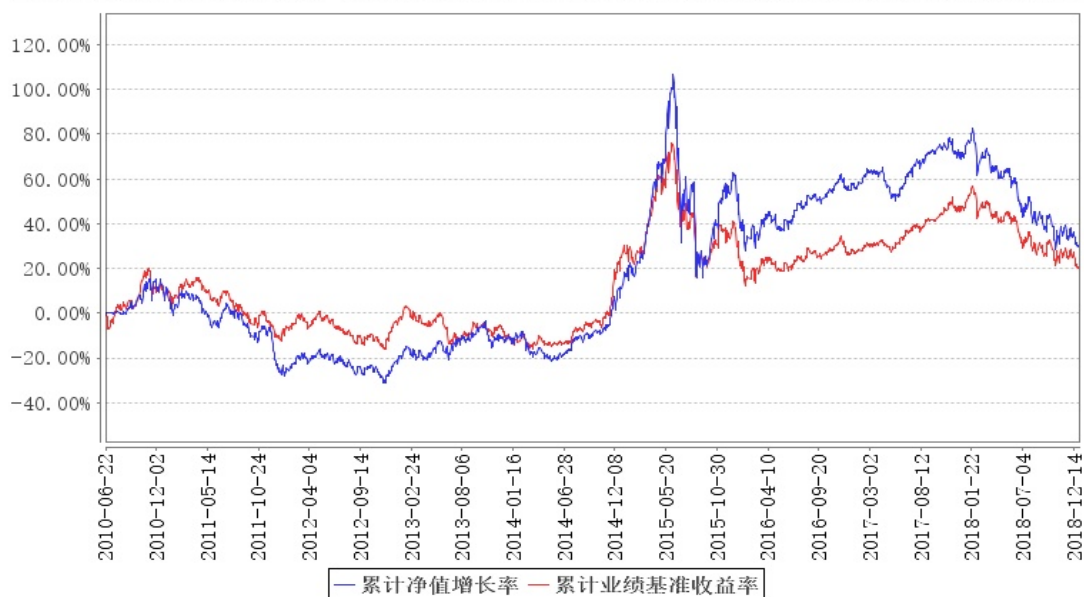
大成核心双动力混合累计净值增长率与同期业绩比较基准收益率的历史走势对比图

注:1、按基金合同规定,本基金自基金合同生效之日起6个月内使基金的投资组合比例符合基金合同的约定。建仓期结束时,本基金的投资组合比例符合基金合同的约定。