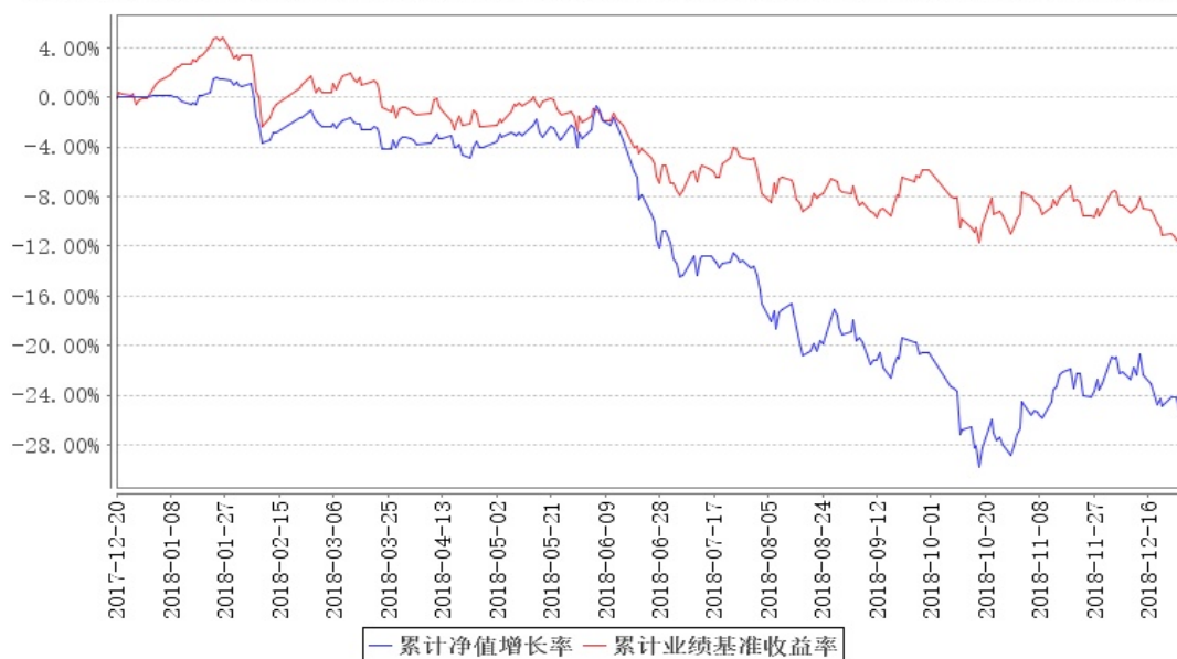
大成盛世精选混合累计净值增长率与同期业绩比较基准收益率的历史走势对比图

注:本基金合同规定,基金管理人应当自基金合同生效之日起六个月内使基金的投资组合比例符合基金合同的约定。建仓期结束时,本基金的投资组合比例符合基金合同的约定。