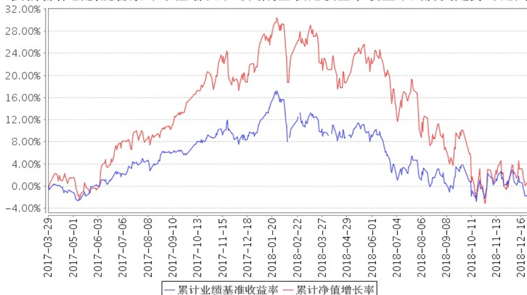
安信合作创新混合累计净值增长率与同期业绩比较基准收益率的历史走势对比图