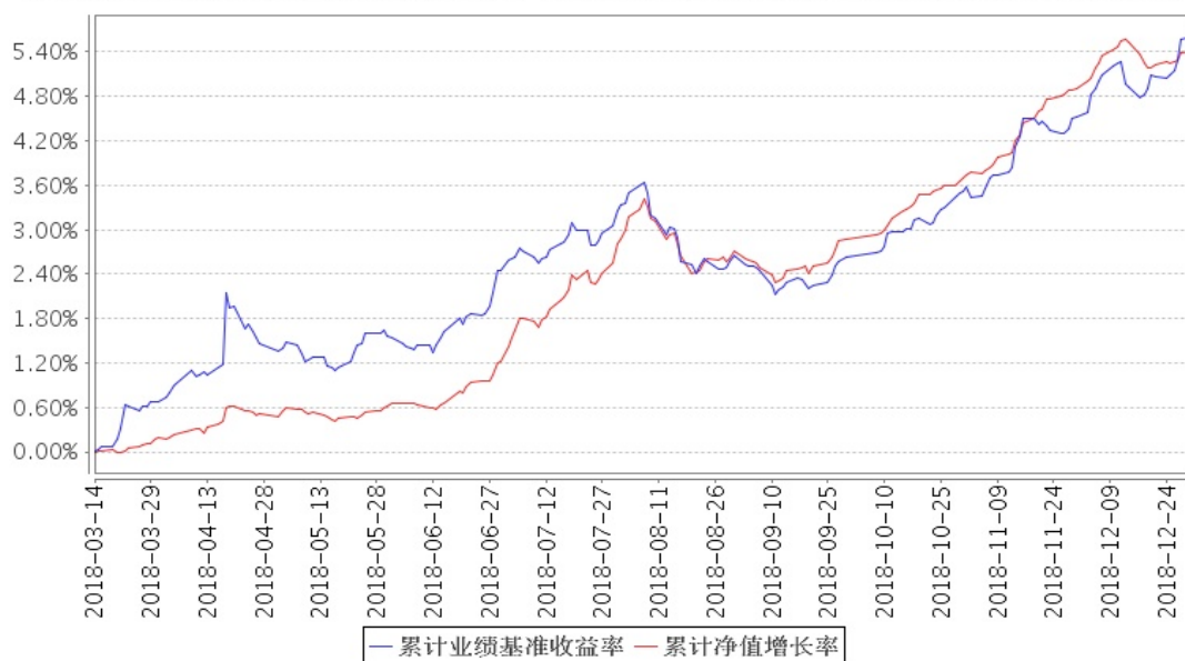
安信尊享添益债券累计净值增长率与同期业绩比较基准收益率的历史走势对比图

注：1、本基金合同生效日为 2018 年 3 月 14 日，截至报告期末本基金合同生效未满一年。