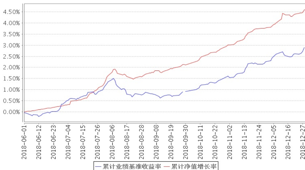
安信永瑞定开债券累计净值增长率与同期业绩比较基准收益率的历史走势对比图

注:1、本基金合同生效日为 2018 年 6 月 1 日,截至报告期末本基金合同生效未满一年。