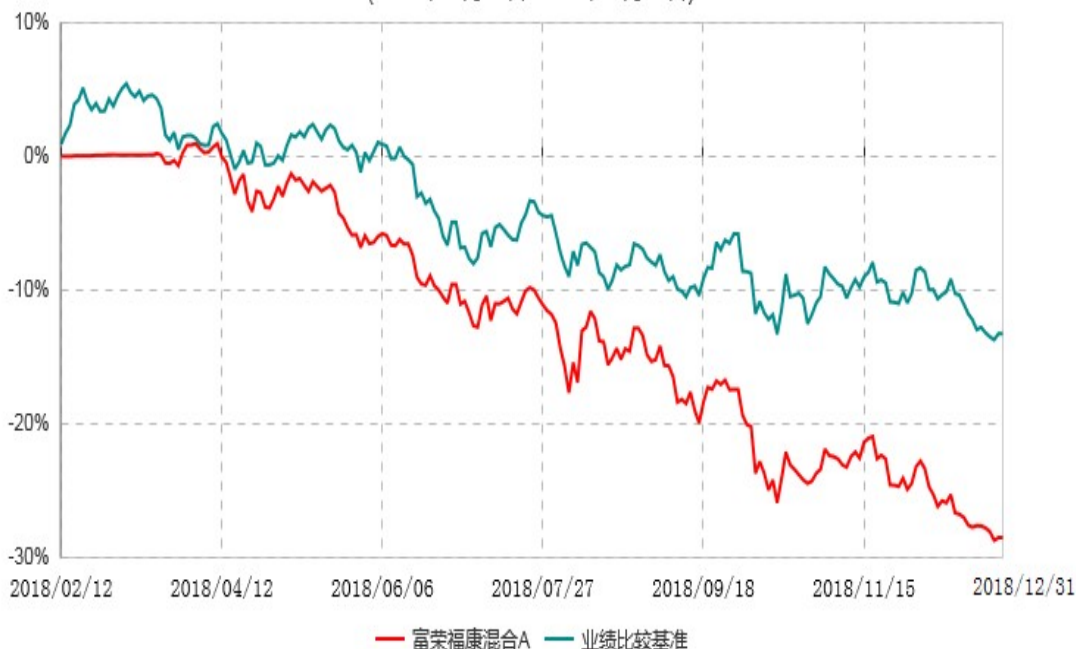
富荣福康混合C累计净值增长率与业绩比较基准收益率历史走势对比图