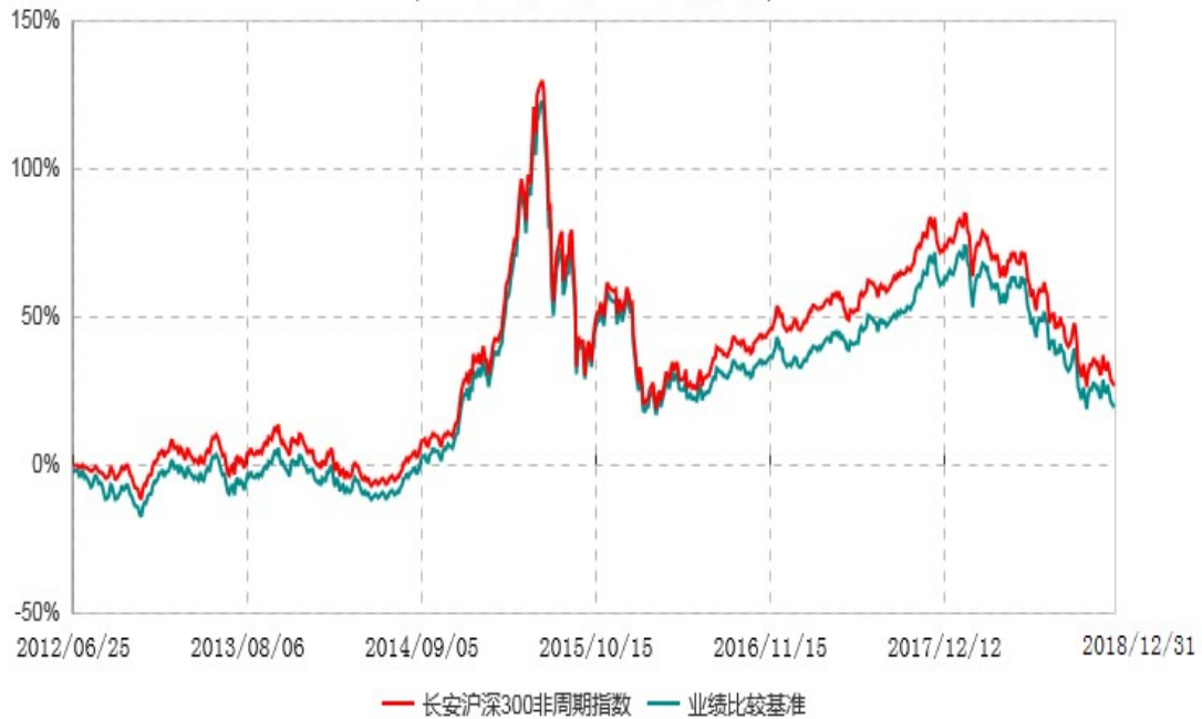
长安沪深300非周期行业指数证券投资基金累计净值增长率与业绩比较基准收益率历史走势对比图 (2012年06月25日-2018年12月31日)

根据基金合同的规定,自基金合同生效之日起6个月内基金各项资产配置比例需符合基金合同要求。本基金在建仓期结束后,各项资产配置比例已符合基金合同有关投资比例的约定。图示日期为2012年6月25日至2018年12月31日。