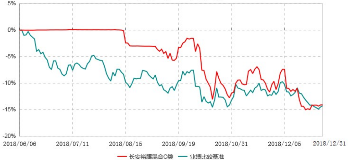
长安裕腾混合C类累计净值增长率与业绩比较基准收益率历史走势对比图 (2018年06月06日-2018年12月31日)

根据基金合同的规定,自基金合同生效之日起 6 个月内基金各项资产配置比例需符合基金合同要求。本基金在建仓期结束后,各项资产配置比例已符合基金合同有关投资比例的约定。基金合同生效日至报告期末,本基金运作时间未满一年。图示日期为 2018 年 06 月 06 日至 2018 年 12 月 31 日。