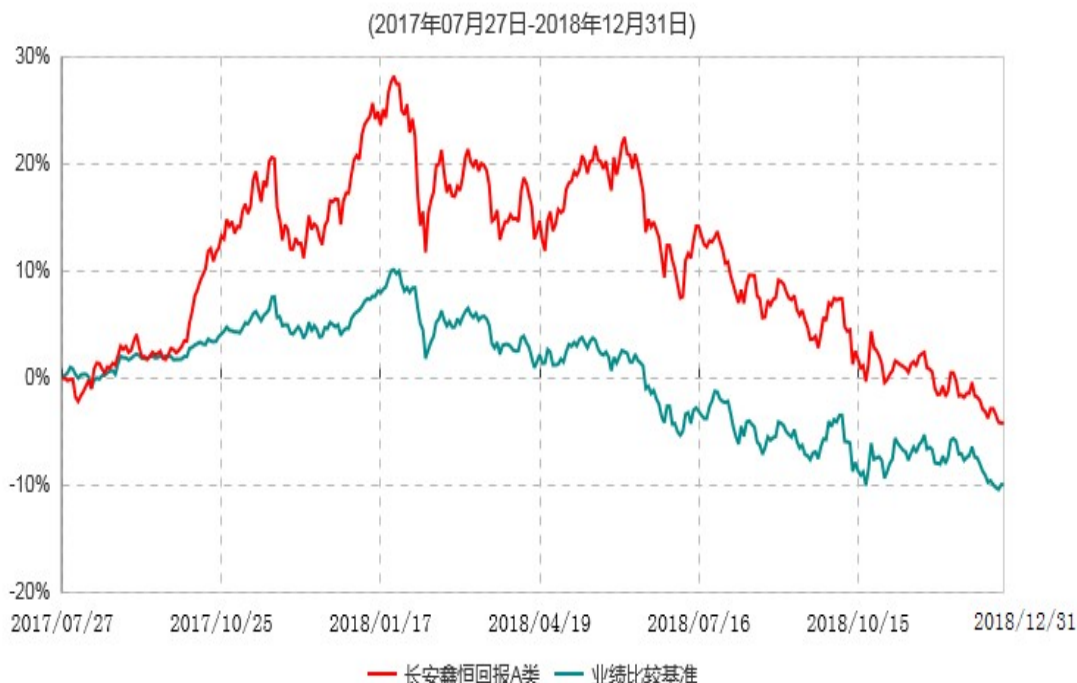
长安鑫恒回报A类累计净值增长率与业绩比较基准收益率历史走势对比图

根据基金合同的规定,自基金合同生效之日起6个月内基金各项资产配置比例需符合基金合同要求。本基金在建仓期结束后,各项资产配置比例已符合基金合同有关投资比例的约定。基金合同生效日至报告期末,本基金运作时间已满一年。图示日期为2017年7月27日至2018年12月31日。