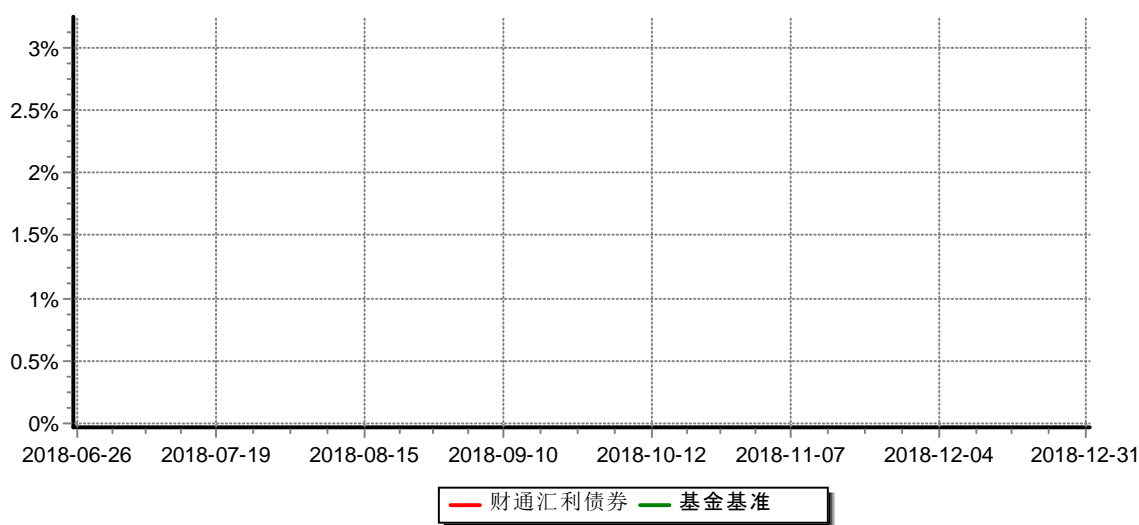
财通汇利纯债债券型证券投资基金 累计净值增长率与业绩比较基准收益率历史走势对比图 （2018年6月26日-2018年12月31日）

注：(1)本基金合同生效日为2018年6月26日，基金合同生效起至披露时点不满一年；