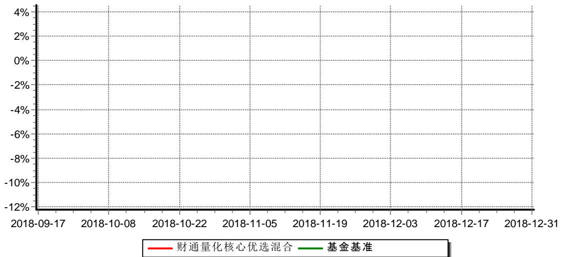
财通量化核心优选混合型证券投资基金 累计净值增长率与业绩比较基准收益率历史走势对比图 （2018年09月17日-2018年12月31日）

注：(1)本基金合同生效日为2018年09月17日，基金合同生效起至披露时点不满一年；