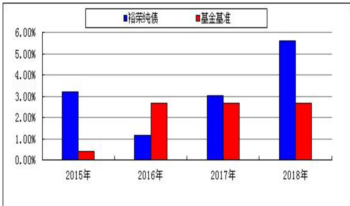
自基金合同生效以来基金净值增长率与业绩比较基准收益率的对比图

注：本基金的基金合同于 2015 年 11 月 6 日生效，合同生效当年按实际存续期计算，不按整个自然年度进行折算。