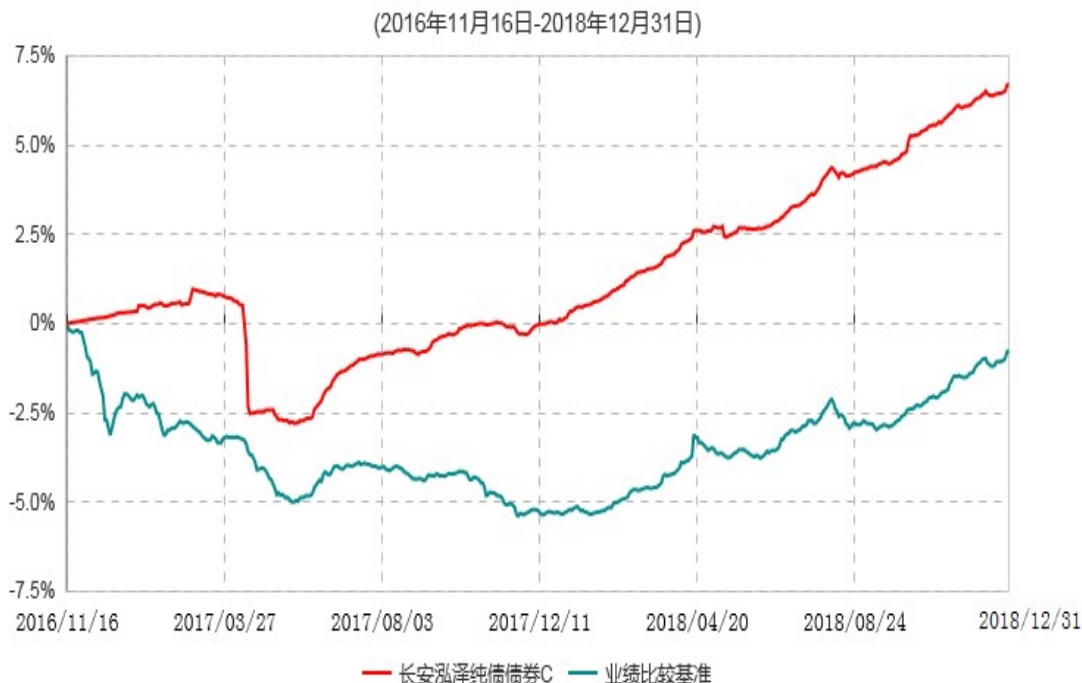
长安泓泽纯债债券C累计净值增长率与业绩比较基准收益率历史走势对比图

本基金基金合同生效日为 2016 年 11 月 16 日，按基金合同规定，本基金自基金合同生效起 6 个月为建仓期，截止到建仓期结束时，本基金的各项投资组合比例已符合基金合同的相关规定。基金合同生效日至报告期期末，本基金运作时间已满一年，图示日期为 2016 年 11 月 16 日至 2018 年 12 月 31 日。