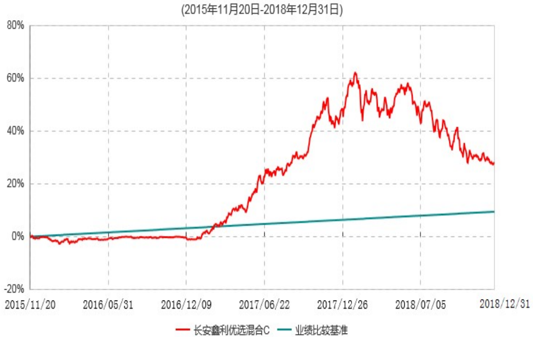
长安鑫利优选混合C累计净值增长率与业绩比较基准收益率历史走势对比图

长安鑫利优选混合 C 于 2015 年 11 月 17 日公告新增，实际首笔 C 类份额申购申请于 2015 年 11 月 20 日确认，图示日期为 2015 年 11 月 20 日至 2018 年 12 月 31 日。