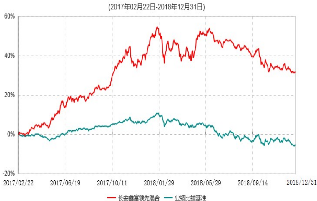
长安鑫富领先灵活配置混合型证券投资基金累计净值增长率与业绩比较基准收益率历史走势对比图

根据基金合同的规定,自基金合同生效之日起6个月内基金各项资产配置比例需符合基金合同要求。本基金在建仓期结束后,各项资产配置比例已符合基金合同有关投资比例的约定。基金合同生效日至报告期期末,本基金运作时间超过一年。图示日期为2017年2月22日至2018年12月31日。