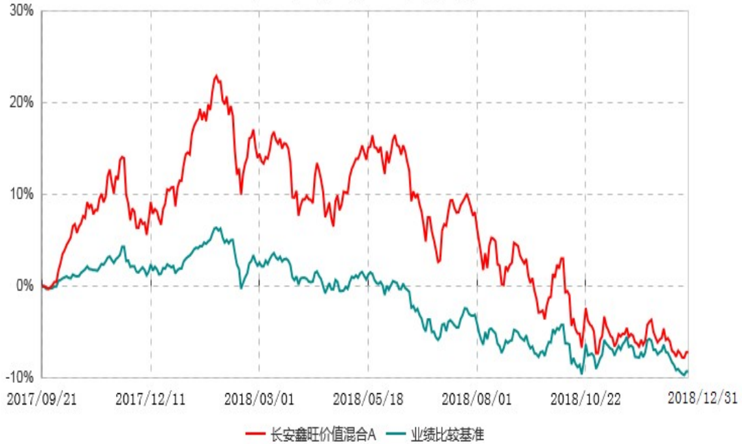
长安鑫旺价值混合A累计净值增长率与业绩比较基准收益率历史走势对比图 (2017年09月21日-2018年12月31日)

根据基金合同的规定,自基金合同生效之日起6个月内基金各项资产配置比例需符合基金合同要求。本基金在建仓期结束后,各项资产配置比例已符合基金合同有关投资比例的约定。基金合同生效日至报告期期末,本基金运作时间已满一年。图示日期为2017年9月21日至2018年12月31日。