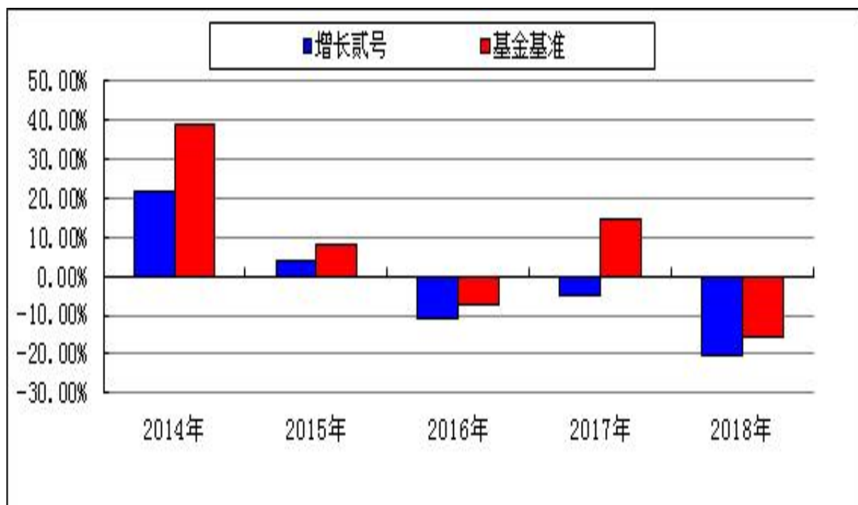
过去五年基金净值增长率与业绩比较基准收益率的对比图