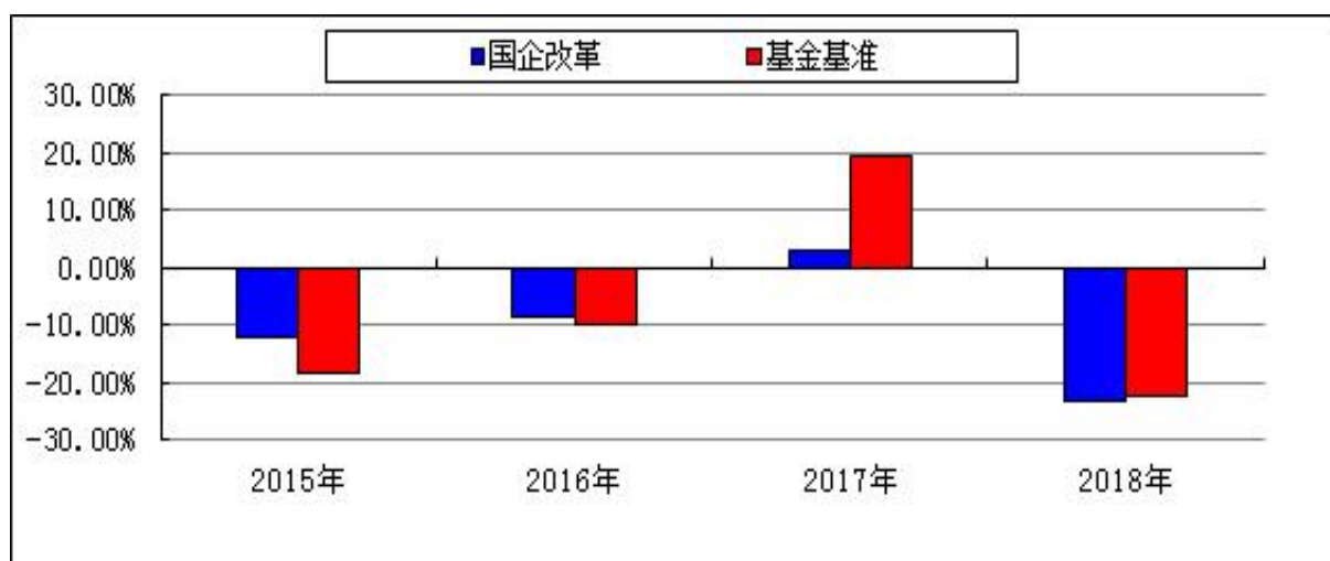
自基金合同生效以来基金净值增长率与业绩比较基准收益率的对比图

注：本基金的基金合同于 2015 年 5 月 20 日生效，合同生效当年按实际存续期计算，不按整个自然年度进行折算。